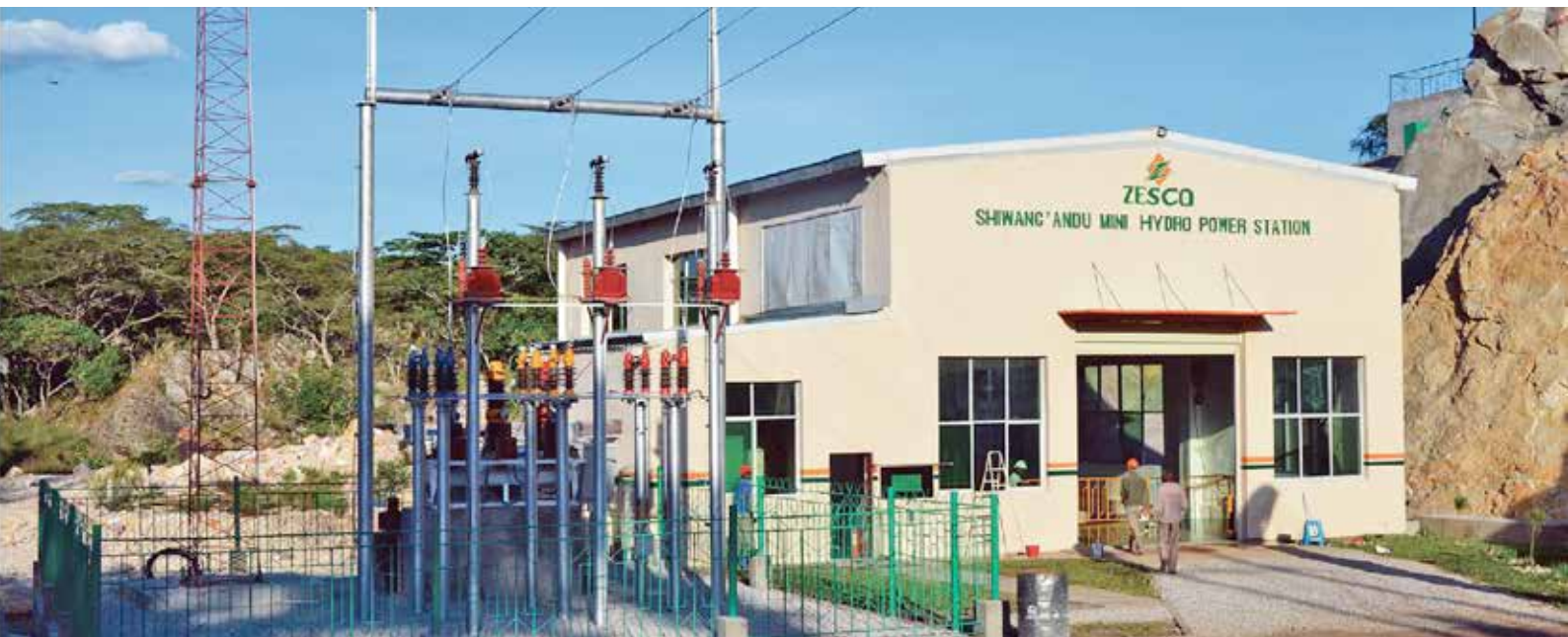
Pequena central hidroeléctrica de Shiwang'andu, Zâmbia